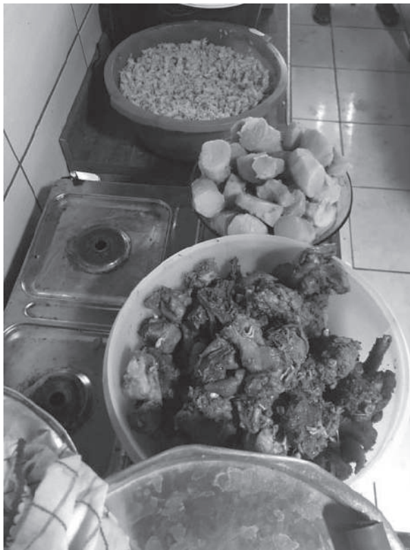
Fig 4 Comidas de festa na Comunidade quilombola da Boa Vista (J. Cavignac, 2018).

Notamos que os produtos “da terra” desaparecem gradativamente das mesas dos sertanejos e migram para os restaurantes famosos da capital, Natal; eles são remasterizados e reapropriados pelos sertanejos abastados, saudosos das comidas da sua infância; ou são oferecidos como pratos típicos para turistas em busca de exotismo. A folclorização dos elementos da cultura nordestina explica os mecanismos e os embates da patrimonialização dos saberes culinários e, de forma concomitante, o desaparecimento progressivo de um sistema alimentar. Torna-se possível, então, questionar os desdobramentos da recuperação, pelos moradores das cidades e pelos setores do turismo, de um patrimônio alimentar oriundo de camadas sociais subalternas que foram despossuídas dos meios de produção agrícola e dos saberes a eles associados.