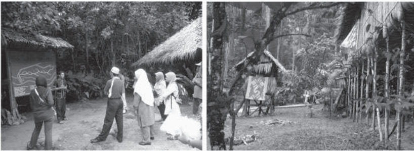
Figure 1 et 2: explications par le guide touristique et maison longue Murut.

Tout est fait pour que le village ressemble à un véritable village, où tout le monde participe à son activité quotidienne. Les acteurs ne vivent pas dans le village, mais arrivent le matin dans un bus collectif, avant les touristes. La plupart d'entre eux vivent dans un immeuble à la périphérie de Kota Kinabalu. La visite dure deux heures, suivie d'une pause d'une heure pour le déjeuner, avec un buffet. Il y a trois sessions par jour. Le voyage de Kota Kinabalu au village dure environ 25 minutes. Le village est situé sur le bord d'une rivière sur une pente, et n'est donc pas propice à l'agriculture. La taille du groupe de tourisme varie considérablement, de deux à plus de 35 personnes. Alors que les guides, tous des hommes, ont reçu un scénario à suivre pour chaque étape de la visite, les variations peuvent être très importantes d'un guide à l'autre. Vêtu d'une chemise traditionnelle Kadazan, le guide explique les règles de la visite aux touristes (il est interdit de fumer, de prendre des objets, de jeter des ordures, etc.) afin de ne pas contrarier les « esprits de la Nature ». Le guide choisit un chef de groupe parmi les touristes, un homme, la plupart du temps. Il doit montrer l'exemple et encourager les autres à participer aux activités du village. (cf. Figure 1 et 2).