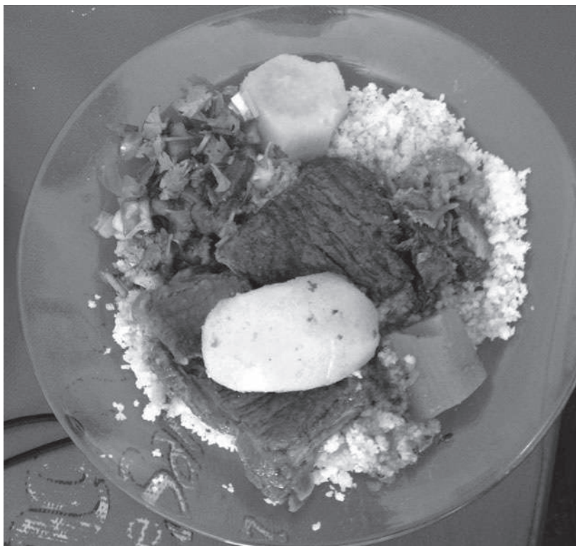
Fig. 2: Prato feito de um restaurante em Caicó (Jocaste Andrade, 2013)

Féculos como inhame, batata-doce e mandioca são partes obrigatórias desse cardápio histórico. Esta última, mais versátil, é consumida em praticamente todas as refeições: além da farinha seca, que pode ser preparada com outros ingredientes (farofa) ou reduzida em caldo (pirão) para acompanhamento de carnes e peixes, a mandioca pode ser cozida ou frita. Também pode ser raspada, lavada, prensada, peneirada e transformada em tapioca, beiju ou grude; a tapioca serve de acompanhamento a preparações salgadas (manteiga, queijo, carne, peixe, etc.) e pode ser consumida pela manhã, à noite ou como lanche, a qualquer momento do dia. Transformada em farinha, o aipim ou, como é conhecido em todo o Nordeste, a mandioca, é consumida durante