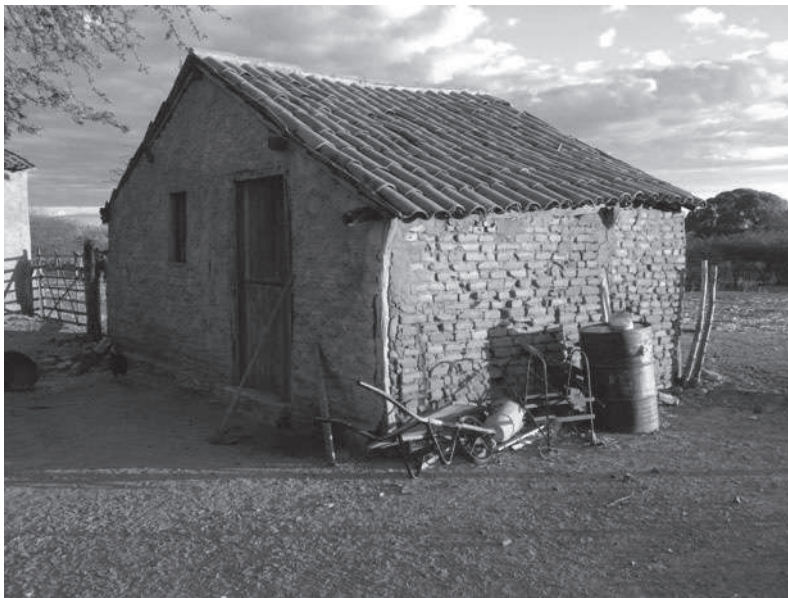
Fig. 1: Casa de sítio em São João do Sabugi (J. Cavnac, 2015)

Outros estudiosos retomam a mesma ideia: os bandeirantes que conquistaram o sertão e exterminaram as populações autóctones no final do século XVII imprimiram um modelo alimentar à base de carne-seca, de farinha e de rapadura (PUNTONI, 2002). O historiador do Seridó Olavo de Medeiros Filho (1981) lembra episódios da vida de Caetano Dantas Correia (1710-1797), originário da Paraíba vizinha, proprietário da Fazenda do Ingá, quando veio se instalar em 1727 no sítio Riacho Fundo, no atual município de Carnaúba dos Dantas. Na crônica que versa sobre a origem da cidade de Acari, no interior do Rio Grande do Norte, encontramos a referência aos produtos derivados da pecuária, a coalhada e a nata, comidas do tempo da colonização dos sertões: