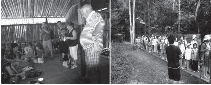
Figure 3. La production de l'alcool de riz. Figure 4. Les touristes attendent à l'entrée de la maison Murut.

L'accent mis par les guides sur la grande consommation d'alcool fort contribue à établir la distance entre un «eux» (primitifs, «alcooliques» et violents) et un «nous» (les touristes civilisés et pacifiques). Certains guides n'hésitent pas à jouer sur l'ambiguïté entre le passé et le présent, ajoutant que la bière a aujourd'hui remplacé l'alcool de riz, ce qui implique, avec la complicité amusée des touristes, que la consommation d'alcool n'a pas diminué 94 . Si les guides, le plus souvent Kadasan-Dusun eux-mêmes, ne s'émeuvent pas de cette présentation peu flatteuse c'est sans doute parce qu'ils aspirent à des emplois et un mode de vie urbain plutôt qu'à la défense des traditions. Ainsi, la typologie d'un affichage de «Soi» pour «Soi» définie par Bruner trouve ici une limite: le «Soi» du Passé et du monde rural peut être moqué par des membres du groupe qui aspirent à la «modernité» incarnée par un mode de vie urbain.